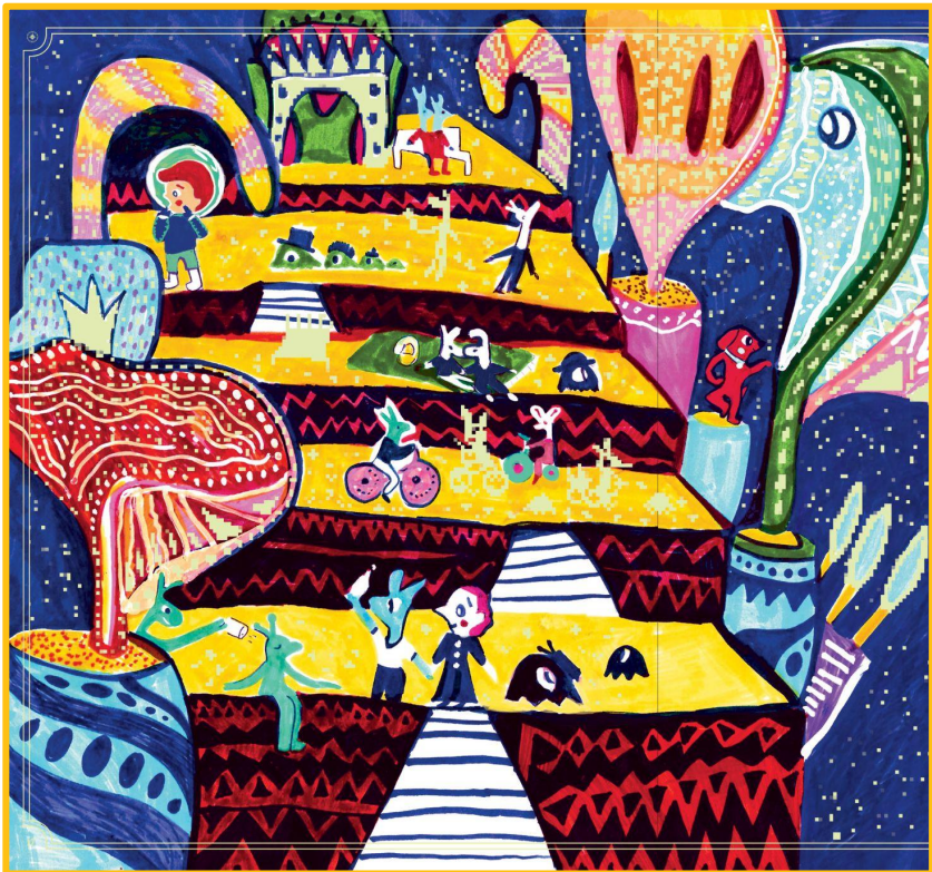
מתוך "איפה רד? המסע למאדים" כתבה ואיירה תמר לב