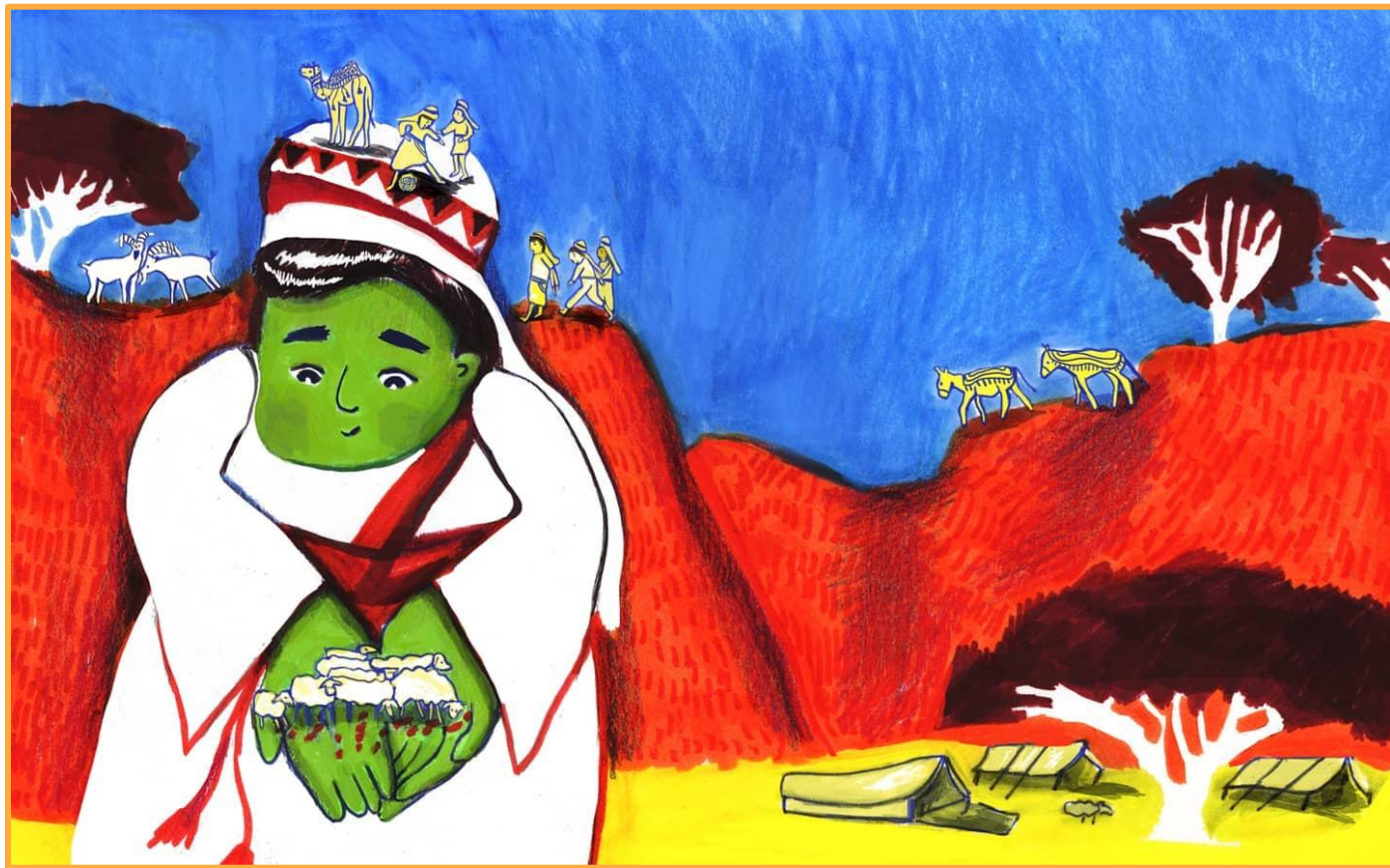
מתוך "עוג מלך הבשן" איור: תמר לב