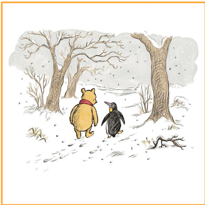
מתוך "פו הדב" מאת א.א. מילן איור ארנסט שפארד