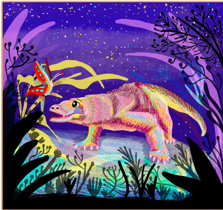
איור: תמר לב